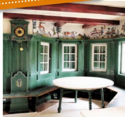
Urstube der Falkenhütte mit Uhr und Wandmalerei