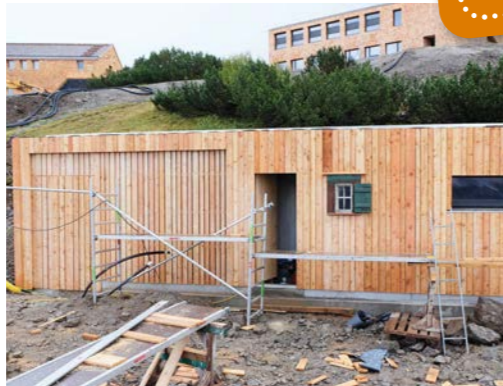
Das neue Technikgebäude wird auch einen Winterraum beinhalten.

Vor allem in der denkmalgeschützten Urstube hat sich viel getan. Sie erstrahlt nun wieder im ursprünglichen Grün, die Uhr und die historische Kredenz wurden instandgesetzt und die Blumenranken an der Decke in liebevoller Handarbeit rekonstruiert. Um den neuen Anbau mit der Urhütte zu verbinden, haben die Zimmerer ganze Arbeit geleistet: Ein schöner, offener Treppenaufgang aus Holz, in dem auch