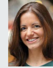
Kristina Frank Oberbürgermeister- kandidatin der CSU

Als Münchner Kindl habe ich schon als kleines Mädchen angefangen, überall herumzukraxeln, wenn mich meine Eltern mit in die Berge genommen haben. Je älter ich wurde, desto anspruchsvoller wurden meine eigenen Touren. (...) Ich mache gern viel Sport, um körperlich und mental frisch zu sein. Da sind Ausflüge in die Berge immer eine wunderbare Gelegenheit, die Schönheit der Alpen zu genießen und Kraft zu tanken. (...) Natürlich bin ich auch schon lange Mitglied im Alpenverein. Das ist für mich als Münchnerin Ehrensache.