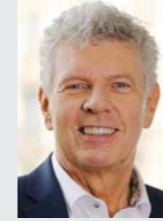
Dieter Reiter Oberbürgermeister der Landeshauptstadt München

Aus Platzgründen geben wir die Antworten gekürzt wieder, in voller Länge sind sie unter www.kbthalkirchen.de/boulderstattbeton zu finden.