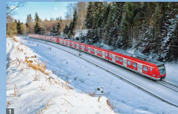
1 Klimaschutz wird nicht ohne umweltfreundliche und emissionsarme Mobilität möglich sein.

Ein weiterer Schwerpunkt lag im Kletterzentrum in Gilching, da die Sektion dort als Besitzerin des Gebäudes den größten Einfluss auf die Infrastruktur ausüben kann. Im Rahmen der Bilanzierung wurden alle Gebäude-Parameter, Veranstaltungen sowie die Mobilität der Kletterhallengäste und Mitarbeiter berücksichtigt. Die Anstrengungen der letzten Jahre zahlen sich dort bereits aus. Die Umrüstung