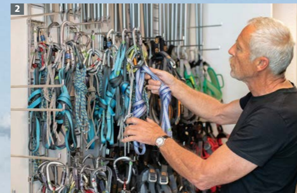
2 Der Ausrüstungsverleih der Sektionen München & Oberland trägt zu nachhaltigem Konsum bei und ist damit letztlich auch klimafreundlich.

der Beleuchtung auf LED spart sehr viel Strom und senkt den Verbrauch regenerativer Energie in der Kletterhalle.